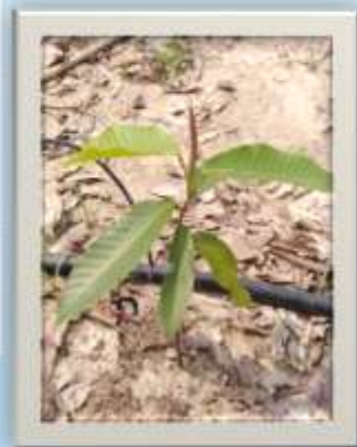
ต้นยางนา