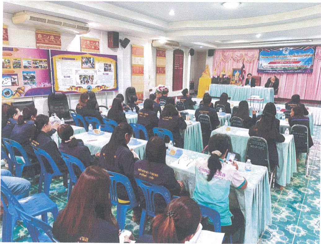
โครงการพัฒนาศักยภาพผู้บริหาร สมาชิกสภา และพนักงานส่วนท้องถิ่น และการมีส่วนร่วมของผู้นำชุมชน ตำบลนาแสง ตามหลักธรรมาภิบาล องค์การบริหารส่วนตำบลนาแสง อำเภอศรีวิไล จังหวัดบึงกาฬ ประจำปีงบประมาณ ๒๕๖๙